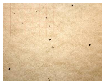
Exempel på bilddokumentation.

Resultatet kan visa hur stor mängd som ansamlats i filter under ett dygns körning. Här kan man tex. utgå efter filtrets vikt vid start jmf. med efter 24 timmars gångtid. Vikten på ansamlat damm kan sen styra, om man vill göra fler åtgärder i att förbättra atmosfären i tex. ett renrum eller annan tillverkningsenhet.